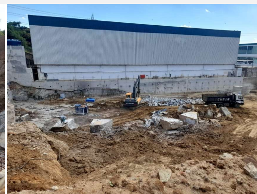
Avenida das Américas 2480, Barra - Cond. Lead Américas Business