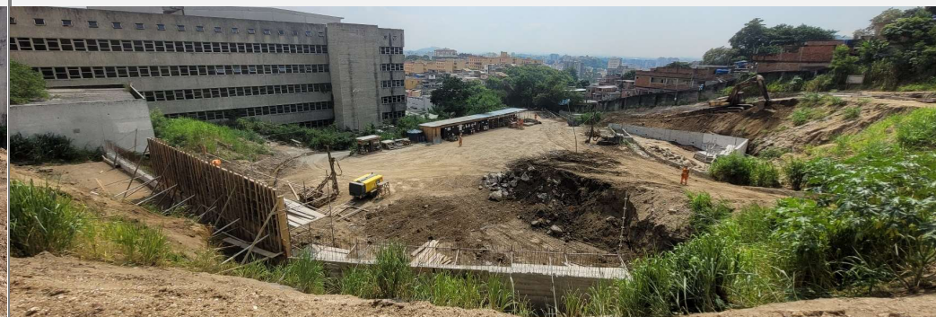
Hospital Naval Marcílio Dias - Engenho Novo