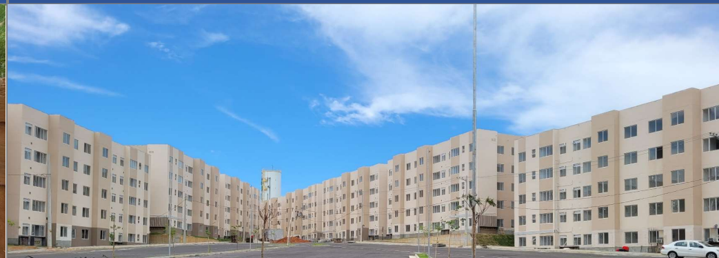
MCMV Rua Macapá 273, Santa Cruz