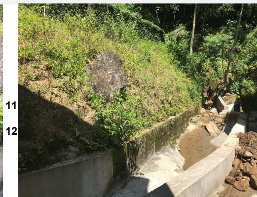
Estrada do Sorimã, Barra da Tijuca

Nota: Este relatório é de propriedade da GEORIO, não podendo ser reproduzido ou utilizado para fins não autorizados sem a anuência desta Fundação. Em caso de dúvidas, entrar em contato com a GEORIO.