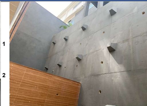
Rua Álvaro Ramos, Botafogo