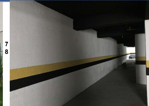
Rua Zoroastro Pamplona, Freguesia, Jacarepaguá