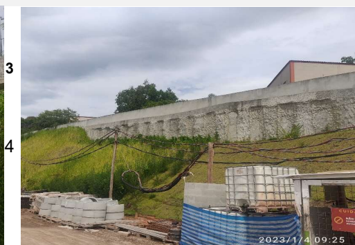
Rua Mirataia, Jacarepaguá